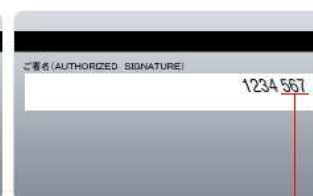
セキュリティコード